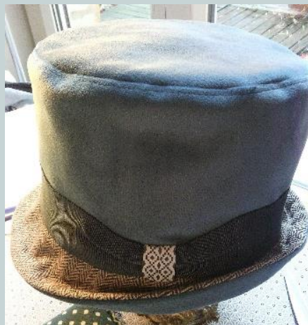
Moi je dis « Chapeau bas l'artiste »

Pour plus d'informations téléphoner au 03 24 37 90 86